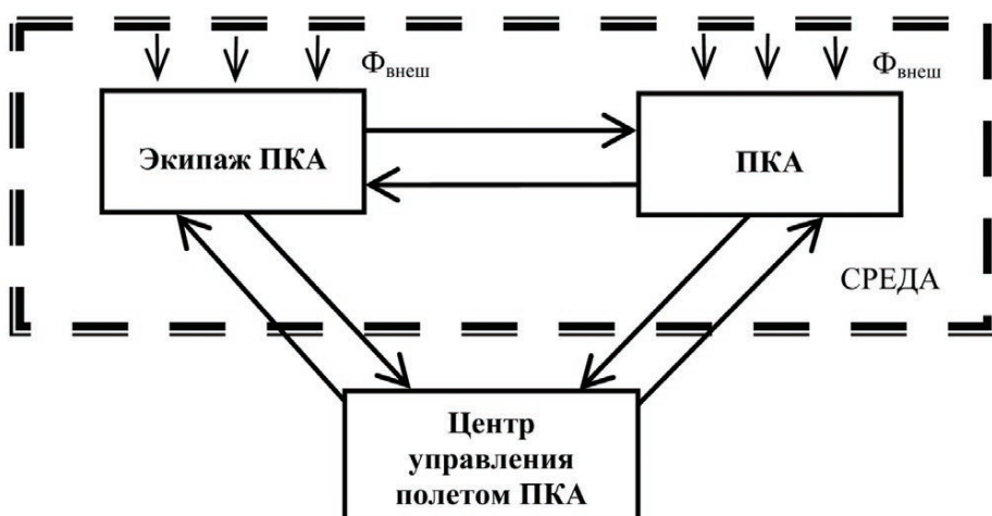
Рис. 1. Система взаимодействия экипажа ПКА

Любая система ПКА в процессе своего функционирования взаимодействует с внешней по отношению к ней средой. Полеты в окололунное пространство сформируют совершенно новые условия выполнения космических